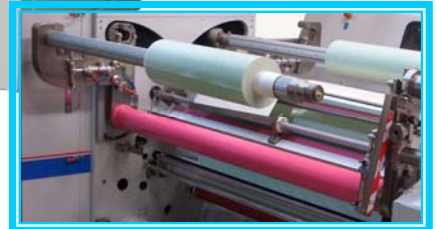
成品卸料架-選購品 (荷重 1.6M-100KG, 1.3M-120KG)